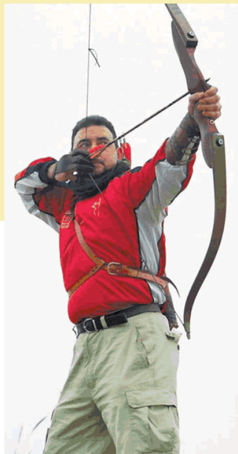
El arco recurvado es característico del tiro con arco deportivo.

Webs de interés Federación Navarra de Tiro Olímpico ( fnavarrotiroolimpico.com ) y Federación Española de Tiro Olímpico ( tirolimpico.org ).