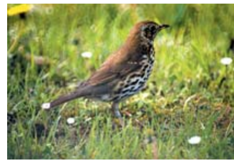
Zorzal común 'Turdus Philomelos'

Es una rapaz de mediano tamaño: longitud de 60-66 cm y envergadura en vuelo de 154-170 cm. Tiene presencia en Navarra todo el año, pero en invierno se reciben ejemplares invernantes de Alemania, Francia, Dinamarca o Suiza. En invierno se agrupa para dormir. Mal cazador, suele aprovechar piezas fáciles de capturar, basura o carroña.