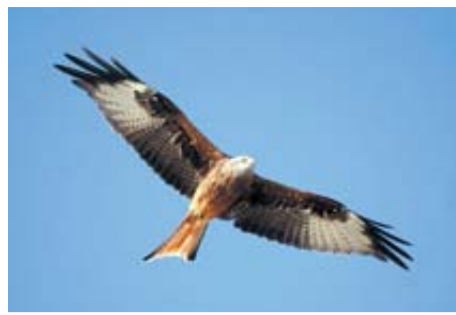
Milano real 'Milvus Milvus'

Es otra de las aves más populares por su canto. Es una especie de gran tamaño (longitud 96-119 cm) y notable envergadura en vuelo (180-222 cm). Es gregaria y, en migración, forma líneas. En nuestra región es ave de paso y con algún raro invernante. Frecuenta zonas húmedas, lagunas, arrozales y campos de cultivo.