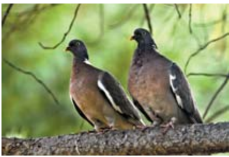
Paloma torcaz 'Columba Palumbus'

Objetivo de cazadores, es, quizá, el ave migratoria más conocida. De tamaño mediano (40-42 cm de longitud y 75-80 de envergadura), la población sedentaria, de carácter forestal, es escasa y se distribuye por casi toda Navarra. En su migración al sur nos sobrevuelan palomas del este y norte de Europa en grandes bandos que apenas recalán aquí.