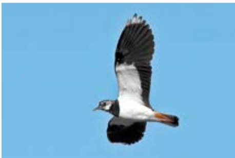
Avefría europea 'Vanellus Vanellus'

SEGÚN LOS EXPERTOS, LAS DIEZ AVES DE ESTA PÁGINA SON EMBLEMÁTICAS CUANDO SE HABLA DE MIGRACIONES. SIGUIENDO EL ORDEN DE LECTURA, LAS CINCO PRIMERAS SUELEN LLEGAR A ESPAÑA Y NAVARRA EN INVIERNO DESDE MÁS AL NORTE; LAS SEGUNDAS, SE VAN AHORA DE AQUÍ A ÁFRICA Y VUELVEN EN PRIMAVERA.