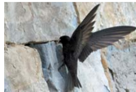
Vencejo común 'Apus Apus'

Son aves muy ligadas a las construcciones humanas para criar. Necesitan corrales o porches con vigas. Son estivales, vienen a criar a Europa en primavera y verano. Al principio del otoño migran al África subsahariana a pasar el invierno. Suelen sobrevolar rebaños, campos en barbecho y zonas húmedas para alimentarse de insectos.