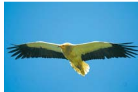
Alimoche 'Neophron Percnopterus'

Rapaz de buen tamaño (longitud de 55-65 cm; envergadura en vuelo de 148-175 cm). Nidifica en cortados y cantiles. En sus prospecciones en pos de alimento utiliza zonas abiertas y puede ser observado en toda Navarra. Llega del África subsahariana en febrero-marzo y su presencia es continua hasta agosto, cuando empieza a migrar al sur. Con frecuencia depende de muladares y vertederos.