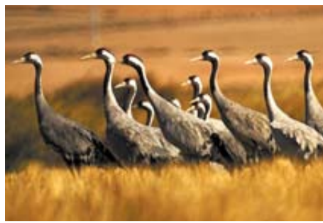
Grulla común 'Grus Grus'

Objetivo de cazadores, es, quizá, el ave migratoria más conocida. De tamaño mediano (40-42 cm de longitud y 75-80 de envergadura), la población sedentaria, de carácter forestal, es escasa y se distribuye por casi toda Navarra. En su migración al sur nos sobrevuelan palomas del este y norte de Europa en grandes bandos que apenas recalán aquí.