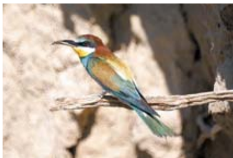
Abejaruco europeo 'Merops Apiaster'

Rapaz de tamaño medio, más abundante al sur de la comunidad y muy ligada a zonas húmedas: bosques fluviales, sotos... También vive en bosques junto a campos abiertos, a veces cerca de pueblos. Su presencia es estival, viene a criar a Navarra. Pasa el invierno en el África subsahariana. Gran cazador de aves, reptiles y mamíferos pequeños.