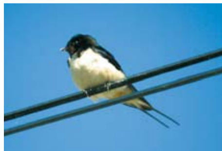
Golondrina común 'Hirundo Rustica'

De mediano tamaño (longitud, 27-29 cm; envergadura en vuelo, 44-49 cm) y muy llamativa por su coloración. Nidifica en cortados terrosos, normalmente en orillas de ríos. Para cazar aprovecha zonas de cultivos de secano y matorral bajo donde encuentra insectos y, en particular, abejas. Migrador transahariano. Llega a Navarra en abril y en agosto vuelve a África.