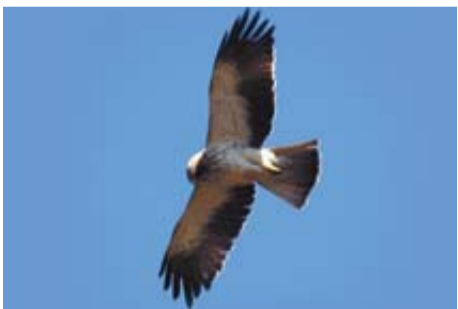
Aguililla calzada 'Hieraetus Pennatus'

Rapaz de buen tamaño (longitud de 55-65 cm; envergadura en vuelo de 148-175 cm). Nidifica en cortados y cantiles. En sus prospecciones en pos de alimento utiliza zonas abiertas y puede ser observado en toda Navarra. Llega del África subsahariana en febrero-marzo y su presencia es continua hasta agosto, cuando empieza a migrar al sur. Con frecuencia depende de muladares y vertederos.