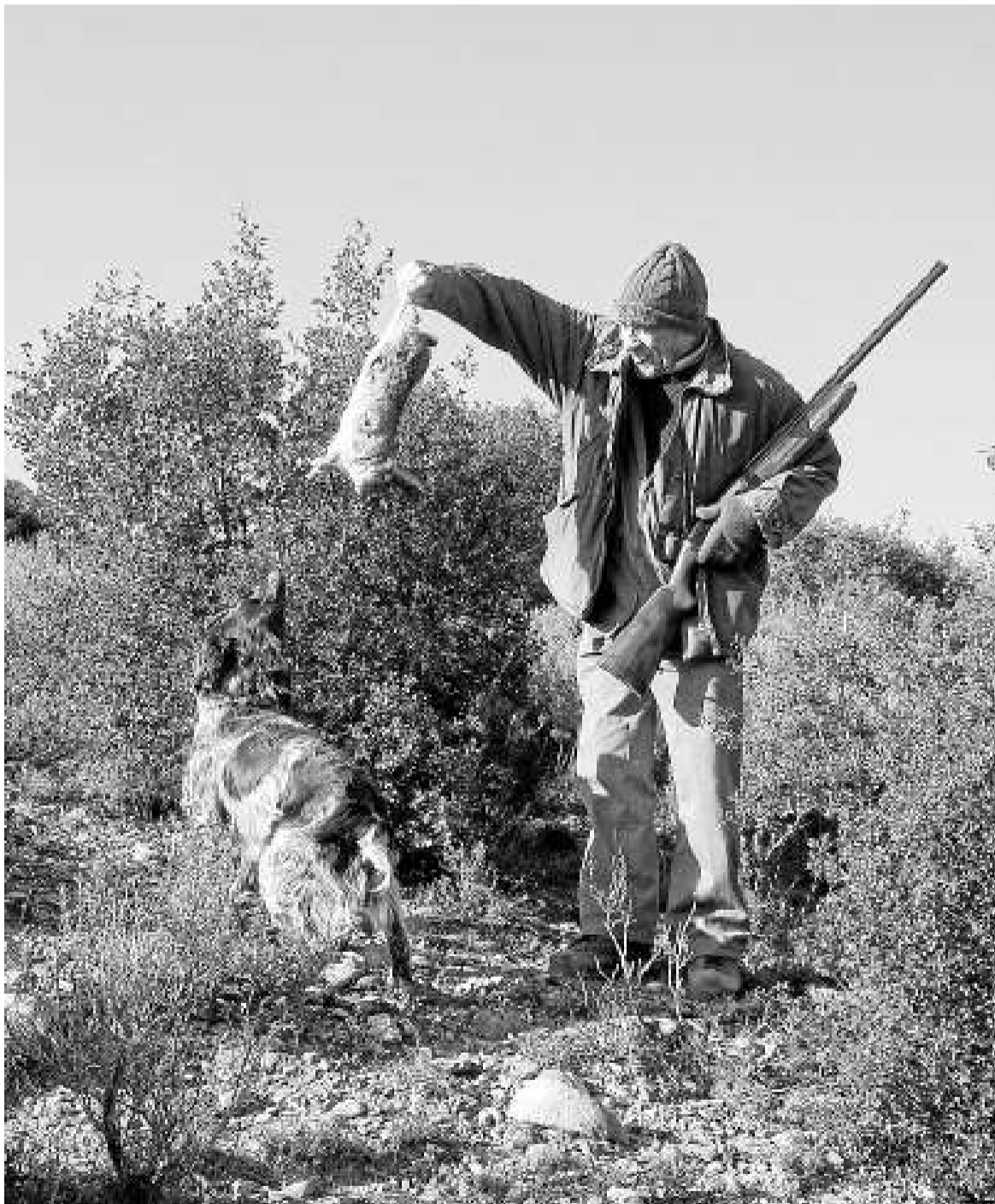
Un cazador, con un conejo.

ADECANA CRITICA QUE SE OBLIGUE A CONTRATARLOS PARA ELIMINAR EL EXCESO DE CONEJOS EN ÉPOCA DE CAZA UTILIZANDO ESCOPETA Y PERRO.